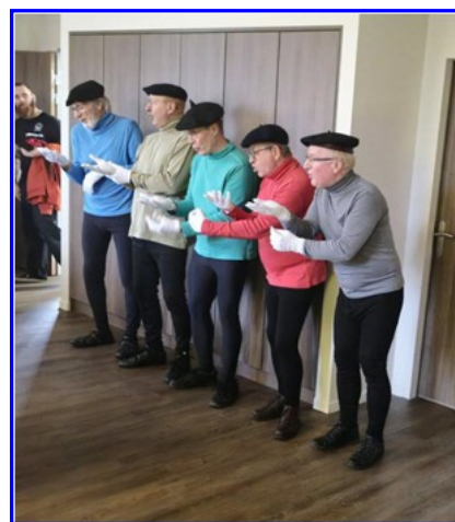
Un moment fort du repas: le spectacle des « frères Jacques » appréciés pour leur humour et leur nostalgie