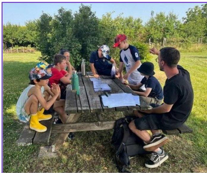
Formation sur le rôle des insectes et des pollinisateurs