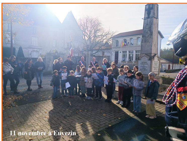
11 novembre à Euvezin

La présence fidèle et rassurante des sapeurs-pompiers d'Essey-et-Maizerais a complété ce tableau républicain. Fidèle à cet esprit de cohésion, la municipalité d'Euvezin a ensuite convié l'ensemble des participants à partager un vin d'honneur, moment de convivialité essentiel pour clore cette matinée sous le signe de la transmission et de l'amitié.