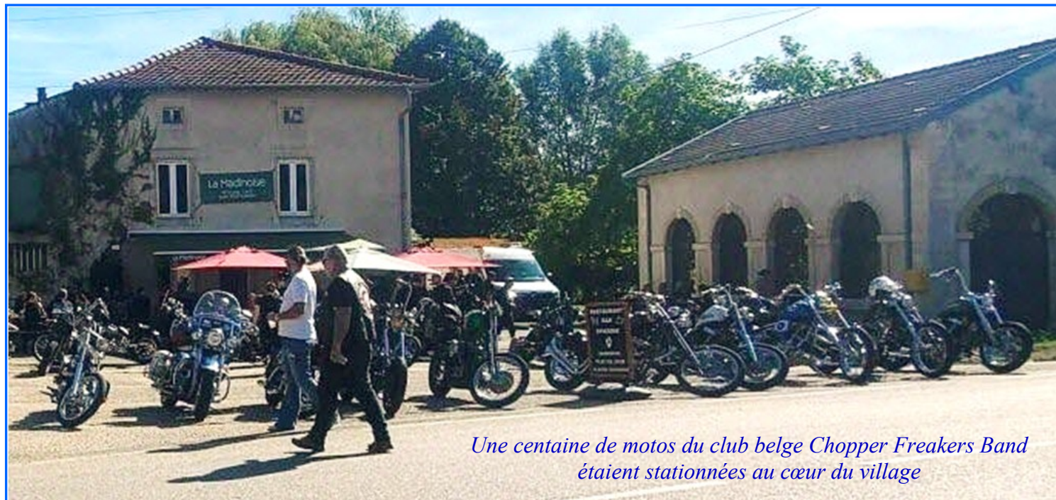
Une centaine de motos du club belge Chopper Freakers Band étaient stationnées au cœur du village

Ce rassemblement international, placé sous le signe de la convivialité et de la fraternité, a permis aux participants de partager un apéritif festif avant de reprendre la route. Comme l'a souligné Oly, membre du groupe, cette étape à Pannes fut un moment fort de leur week-end de balade. Le cortège a ensuite filé vers le camping de Jaulny pour poursuivre les festivités autour de leur passion commune.