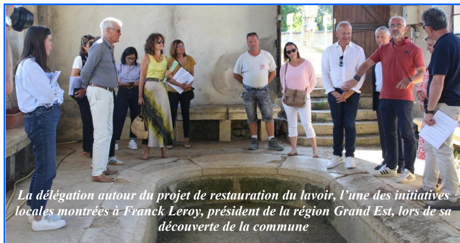
La délégation autour du projet de restauration du lavoir, l'une des initiatives locales montrées à Franck Leroy, président de la région Grand Est, lors de sa découverte de la commune

Le projet phare : le lavoir de 1850: Le maire a dévoilé le projet de restauration du lavoir historique situé au bord de la Madine. Au-delà de sa remise en eau, ce site patrimonial sera doté d'aménagements modulables pour accueillir des manifestations. Cette initiative allie préservation de l'histoire et création de lien social, améliorant durablement le cadre de vie des habitants.