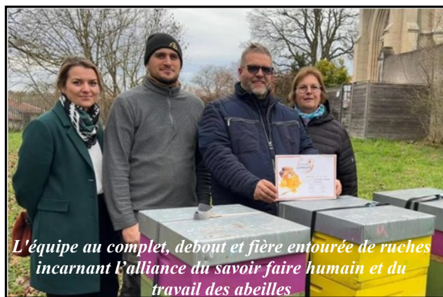
L'équipe au complet, debout et fière entourée de ruches incarnant l'alliance du savoir faire humain et du travail des abeilles

Pour le concours des Miels lorrains, les apiculteurs de Pannes n'ont pas fait les choses à moitié. Dimanche 19 octobre à Neufchef, leur miel crémeux a surclassé la concurrence en décrochant la médaille d'or . Cette distinction suprême vient récompenser non seulement la finesse d'un produit du terroir, mais aussi une aventure humaine collective.