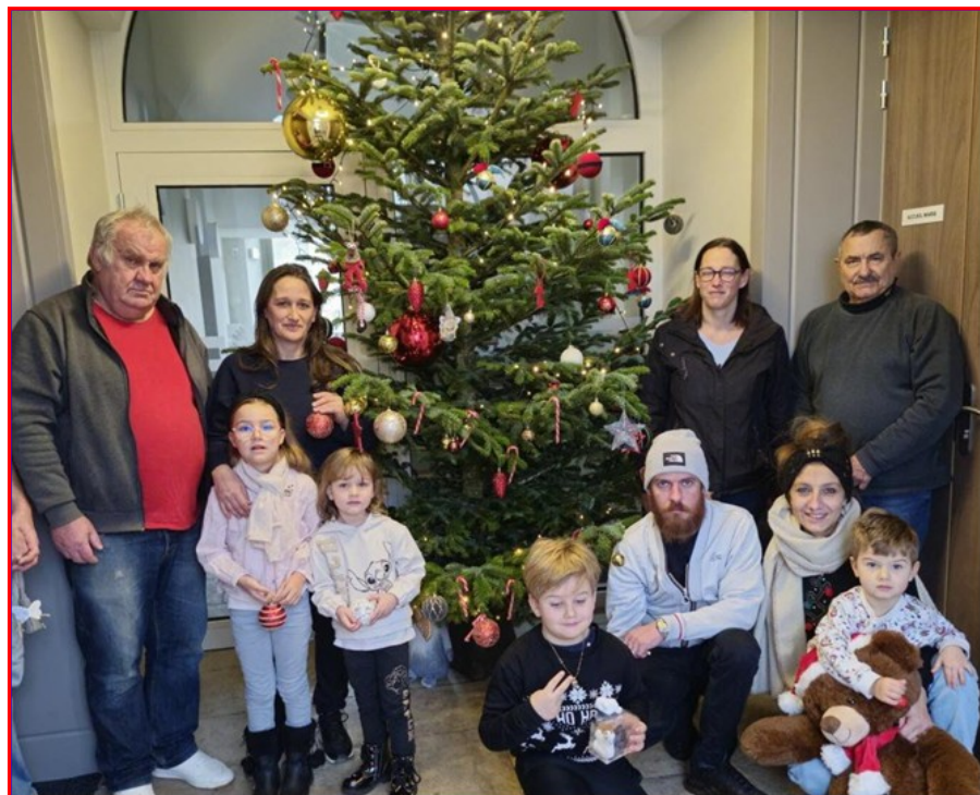
Les enfants fiers de leurs décorations sans casse ou presque accompagnés de leur famille

Après l'effort, la municipalité a offert un rafraîchissement convivial à tous les participants. Désormais, le sapin brille si intensément qu'il est visible depuis la route, offrant aux passants un chaleureux avant-goût des fêtes.